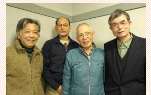
磐田観光ボランティア 「ふれあいガイドの会」