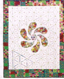
シンプリシティガーデン / 鷺沢玲子