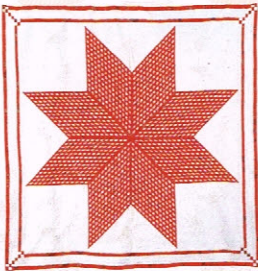
ベツレヘムの星 / 鷺沢玲子