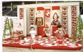
不思議の国のアリス