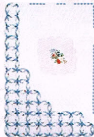
ダイヤモンドウェディングリング / 鷺沢玲子