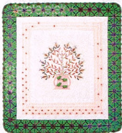
マルベリーのバラ / 鷺沢玲子