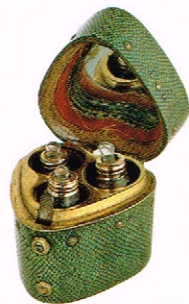
三組ハート型ケース入香水瓶 (18世紀 フランス)