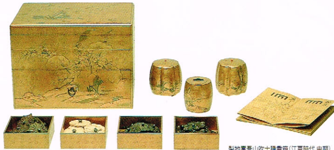
梨地薬山吹十種香箱(江戸時代中期)

本展では、開館20周年を迎えた磐田市香りの博物館がこれまでに蒐集した、香りに関する美術工芸品を約80点展示致します。18世紀に作られた美しい彩色のガラス香水瓶や、徳川家と毛利家の婚礼の際に眺えられたとされる梨地薬山吹十種香箱など、西洋の香りの器から日本の香道具類まで、「香り」をテーマとした博物館ならではのコレクションをご覧ください。また、20年に渡り開催してきた企画展のポスターもあわせて展示し、開館からの歩みを紹介致します。香りを“観て”、香りを“学ぶ”、多様な香りの世界をお楽しみください。