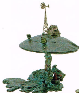
富田亮平作バスターレ (2000年)