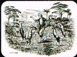
ヤギ飼い「カルディ」のコーヒー伝説