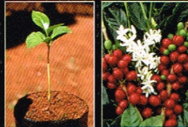
コーヒーの木の一生