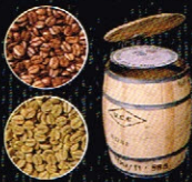
コーヒー豆の香り比べ 協力：高砂香料工業㈱／高砂珈琲㈱