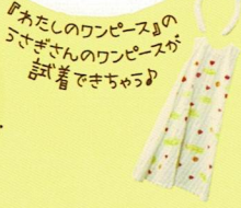
『わたしのワンピース』のうさぎさんのワンピースが試着できちゃるよ！