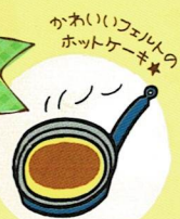
かわいいフェルトのホットケーキ★