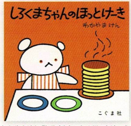
わかやまけん『しろくまちゃんのほっとけーき』

「こぐまちゃんえほん」シリーズから、大人気の『しろくまちゃんのほっとけーき』を紹介！ ホットケーキのあま〜い香りも…♡