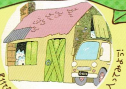
『11ぴきのねことあほうどり』のぶたのいえに入ってみよう！