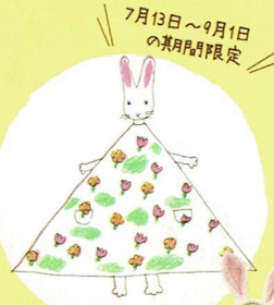
7月13日～9月1日 の期間限定！