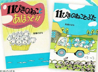
馬場のぼる『11ぴきのねことあほうどり』 馬場のぼる『11ぴきのねことぶた』