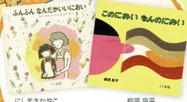
にしまさかやこ『ふんぶんなんたがいににおい』 柳原良平『このにおいなんのにおい』