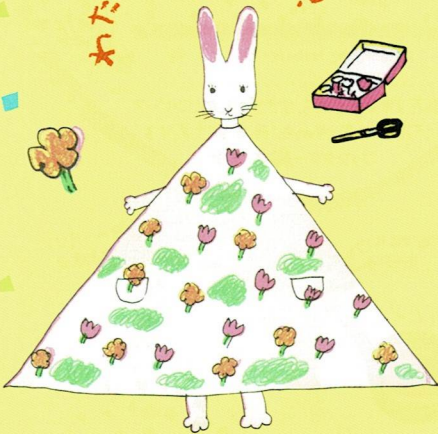
にしきかやこ「わたしのワンピース」