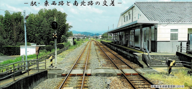
天竜浜名湖線豊岡駅(2019)