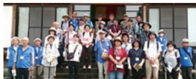
観光ボランティアさんと イベントに参加された方々

ふれあいガイドさんって知ってますか? なんと〜知ってるけど…って方がほとんどか と思います。ガイドさんは、観光スポットや名所・ 旧跡などを一緒に行って案内してくれるんです。 地元で伝わるお話やパンフレットには載ってない 裏話などなど…おもしろいお話がたくさん聞けま すよ〜。2週間前までに電話かFAXでお申し込み みください。磐田の魅力をたっぷりお届けします! くわしいお問い合わせは、 磐田市観光協会 ☎0538-33-1222まで