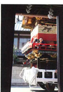
廻船問屋から屋台を見る